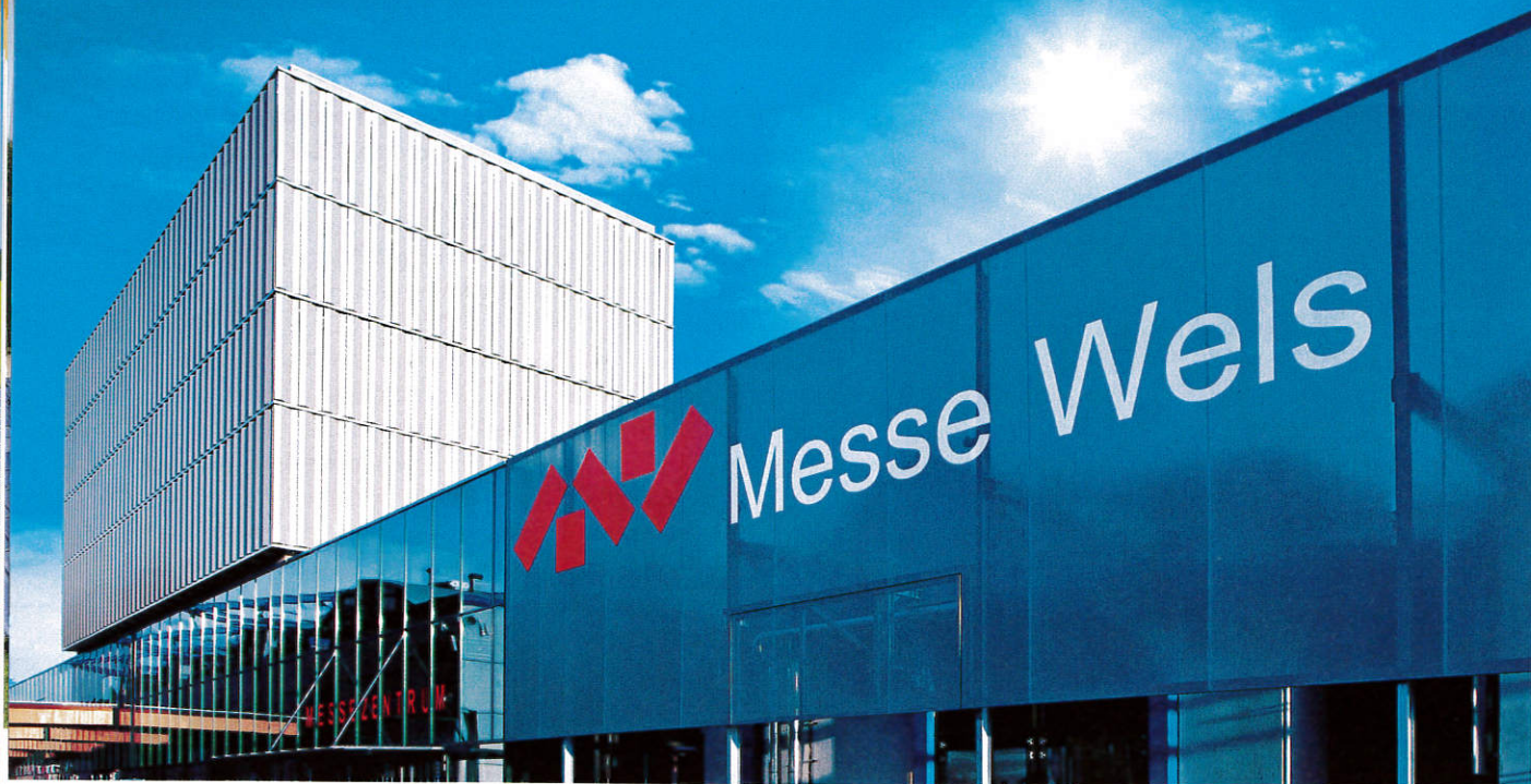
▲ Abbildung 1: Neue Messehalle auf der die Anlage errichtet wurde