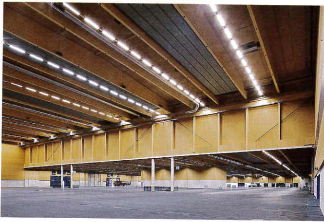
▲ Abbildung 2: Neue Messehalle mit großen Spannweiten